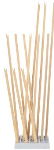
Esche unbehandelt ash untreated