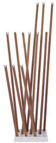
Nussbaum geölt walnut oiled