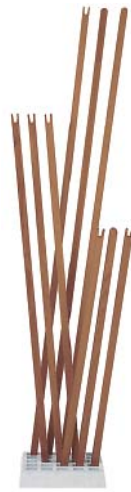
Nussbaum geölt walnut oiled