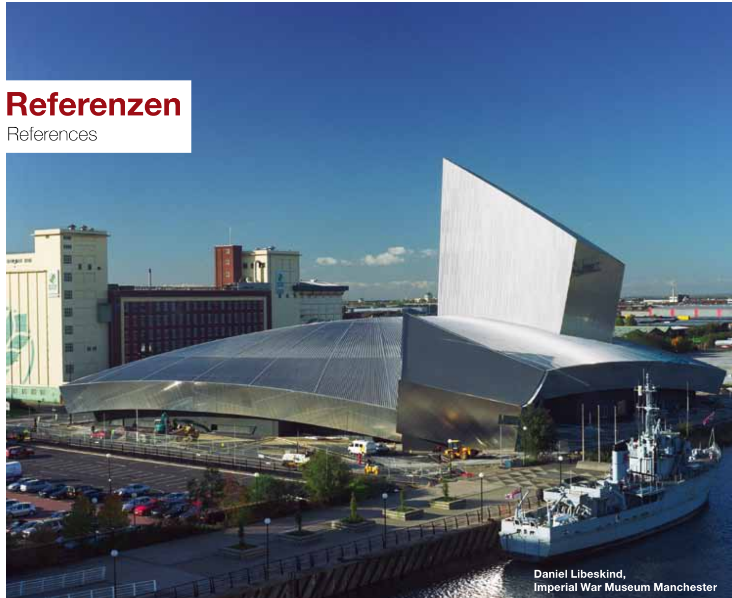
Daniel Libeskind, Imperial War Museum Manchester

Ahrenschoop Kunstkatzen | Aalen Fachhochschule Aalen | Augsburg Fachhochschule Augsburg FB Gestaltung | Aschaffenburg Stadthalle | Bad Mergentheim Caritas-Krankenhaus | Bamberg Neue Residenz – Kaisersaal | Bern (CH) Medizentrum für Bildung | Berlin Max-Schmeling-Zentrum, Radsporthalle am Prenzlauer Berg, Max-Planck-Institut für Wissenschaftsgeschichte, Bundesverkehrsministerium, Evang. Geriatriezentrum, Stilwerk, Bach Gymnasium, Freie Universität Bibliothek Rostlaube | Bitterfeld Berufsschulzentrum Bitterfeld | Bochum Universität | Bremen Universität | Bremerhaven Deutsche Auswandererhaus DAH | Burg Giebichenstein Hochschule für Kunst + Design | Darmstadt Jazz-Institut, Fachhochschule Darmstadt Fachbereich Architektur | Dessau Fachhochschule Anhalt, Bauhaus Universität | Detmold Fachhochschule Lippe | Dresden Max-Planck-Institut für chem. Physik fester Formen, Technische Universität | Duisburg Mercatorhalle | Düsseldorf Johanniskirche, Stilwerk | Ebersbach Krankenhaus Ebersbach | Erding Sonderpädagogisches Schulzentrum Dorfen | Erlangen Areva, Framatome ANP GmbH | Essen Choreografisches Zentrum