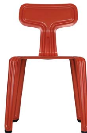
pulverbeschichtet rot powder coated red