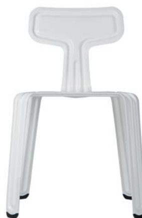
pulverbeschichtet weiß powder coated white