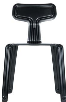
pulverbeschichtet schwarz powder coated black