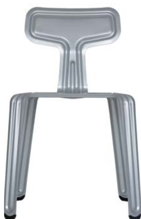
pulverbeschichtet silber powder coated silver