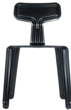
pulverbeschichtet schwarz powder coated black RAL 9005